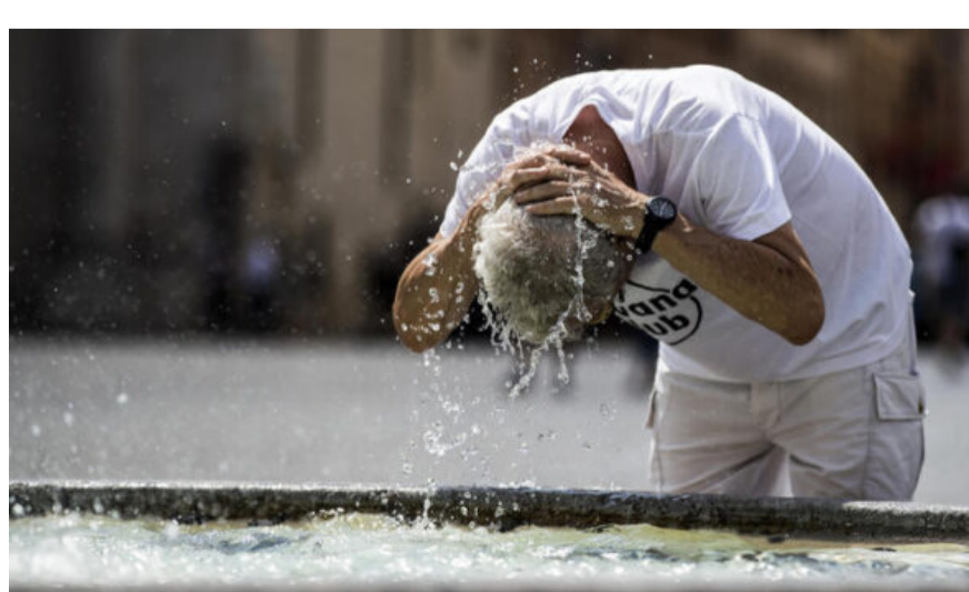
Caldo killer, eccesso di mortalità del 21%