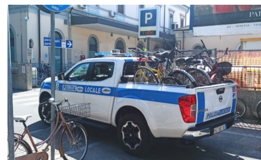
Polizia locale: rimosse 45 bici e un monopattino, abbandonati sul territorio comunale